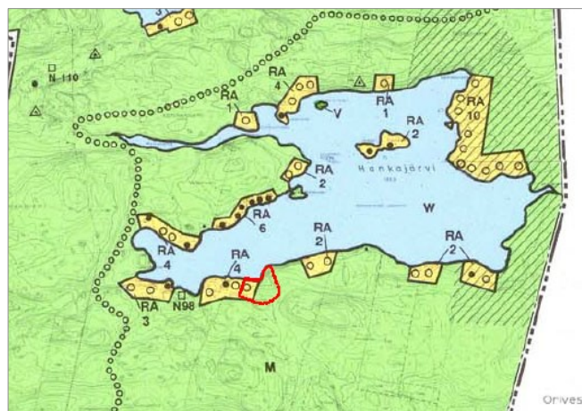
Kuva 3. Ote Aitolahti-Teisko rantayleiskaavasta. Kaava-alue on rajattu punaisella.

Ympäristöministeriön 28.2.1994 vahvistamassa Aitolahti-Teisko rantayleiskaavassa suunnittelualueen länsiosaan on osoitettu lomarakennuspaikka (RA). Muu osa alueesta on osoitettu maa- ja metsätalousvaltaiseksi alueeksi (M).